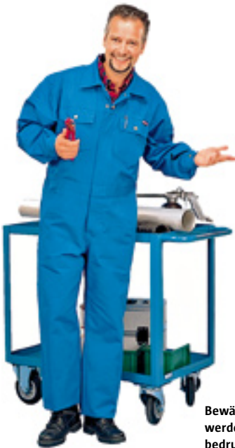
Bewährte Produkte von Planam werden von Gidutex bestickt oder bedruckt

nehmen Gidutex mit dem eigenen Firmenlogo beziehen. Vor allem im Außeneinsatz eignet sich der klassische „Blaumann“, das Sortiment „BW 345“ bestehend aus Jacken, Hosen und Overalls, das aber außer in korblau in bis zu vier weiteren Farben erhältlich ist. Bei besonderer Beanspruchung empfiehlt der Hersteller die strapazierfähige teflonbeschichtete Hochleistungsfaser Cordura aus dem Sortiment „Canvas 320“. Der Textilveredler Gidutex ist Spezialist für Bestickung, Bedruckung und Sonderanfertigungen von Corporate Fashion und Arbeitskleidung.